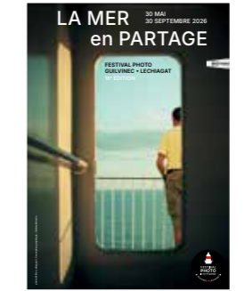
Affiche du festival 2026 40x60 cm : 5 €

LES LIVRES DES PHOTOGRAPHES et bien d'autres à la librairie du Guilvinec De l'Encre à l'Ecran 1 rue Jules Baudry