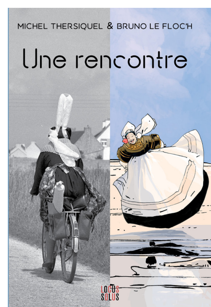
éd. Locus Solus, 2017

Bonne visite à toutes et tous ! Kavadenn vat !